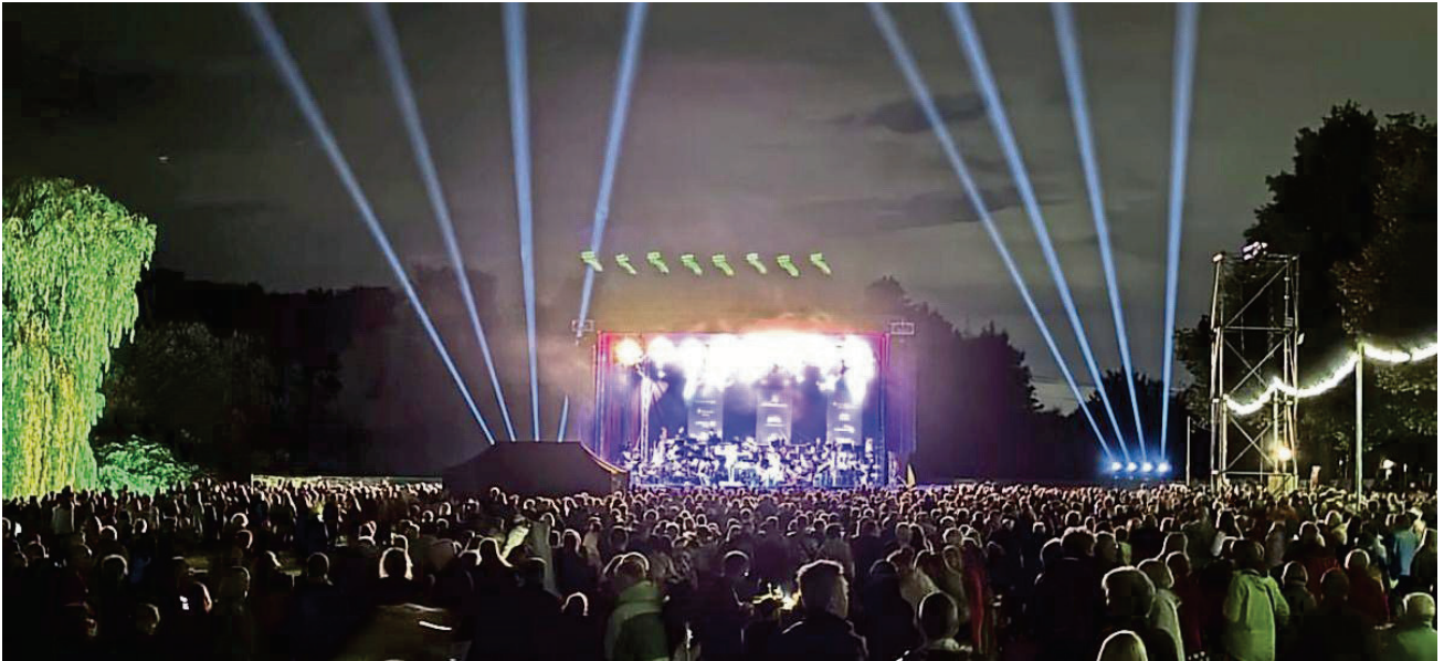
Sorgen für den Wow-Effekt: Laserstrahlen gen Himmel und die bunt beleuchtete Bühne.