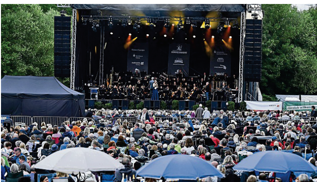
Wilhelmshaus im Herzen: Zum dritten Mal fand die Sommernacht nicht mehr im Staatspark, sondern auf den Mainwiesen statt.