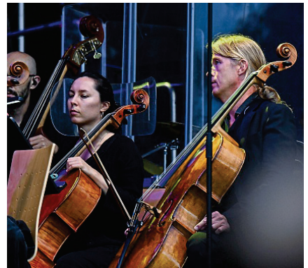
Topmusiker: die Neue Philharmonie Frankfurt.