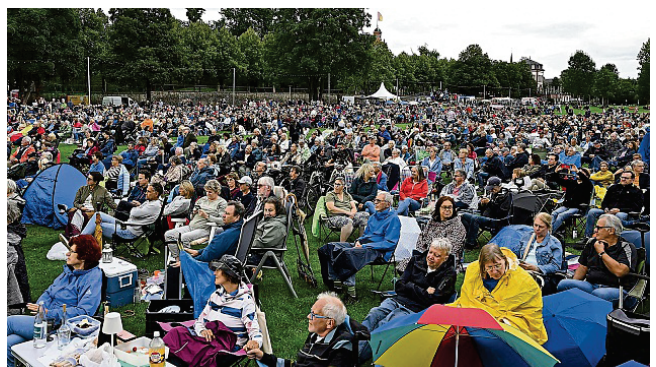
Gewappnet gegen den Regen, der dann doch nicht kam, waren die Zuschauer mit Schirmen und Regenjacken.